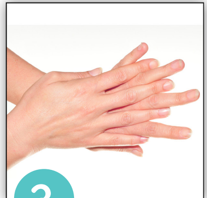
Handfläche auf Handrücken