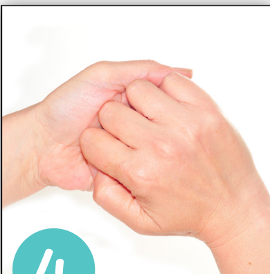
mit verschränkten Fingern