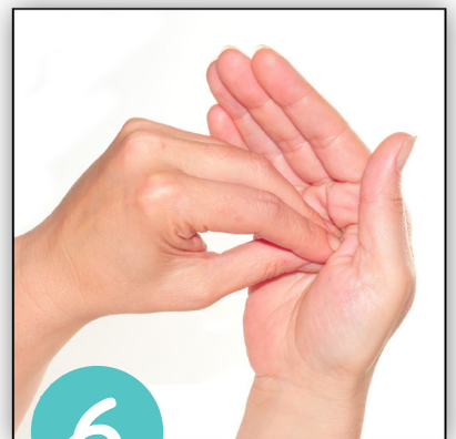
Finger auf Handfläche